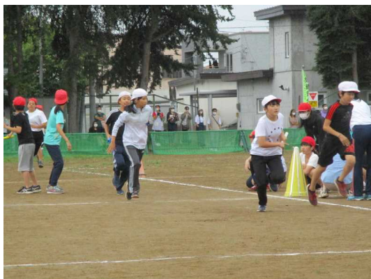
6年生のリレーより