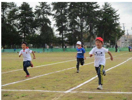
1年生の徒競走より

その運動会の代替え行事として今年度は学年ごとにスポーツフェスティバルを実施しました。9月30日(水)に行った3年生のスポーツフェスティバルをもって、すべての学年が終了しました。保護者・地域の皆様の応援・声援ありがとうございました。