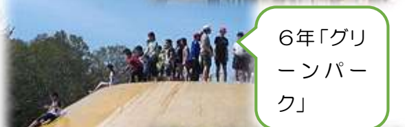
6年「グリーンパーク」