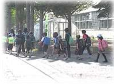
(上級生は下級生の手をとって下校)

皆さん大変手際がよく、協力体制もバッチリでしたので、予定した時刻より早く終了することができました。清々しい環境のもとで運動会を実施できそうです。ありがとうございました！！