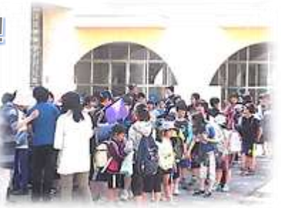
(早く集まることのできるかな?)

5月23日（月）に、 集団下校訓練 を行いました。方面ごとに縦割り班で動く練習です（赤・青・黄・緑・紫・橙・白）。主に自然災害や緊急事態時に登下校の安全を確保するために必要と判断した時に結成する集団です。（もちろん、登下校困難な場合はご家庭のお力をお借りしますが・・・）。上級生が下級生の手を引いて行動する姿が立派でした。 (2度目の遠足気分の人が出たって？そんなバカな！そんな人はおらんです。ホント！)