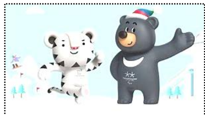
(スラホン & パンダビ)

さて、3学期をスタートさせるにあたって校長先生から二つお話をしますから最後までしっかり聴いてください。3学期はじめての「目線をそろえる」活動ですよ。一つ目は、3学期を「1 + 2」の「3」学期にして欲しいということです。どういうことかと言うと、3学期の「3」の意味をただ1・2・3・・・と数字を数えただけの「3」にして欲しくないということです。今日から始まった3学期は、1学期と2学期がたし算されてできた「3」であると考えて欲しいのです。ですからまず、3学期は、1学期や2学期に出来ていたことが出来なくなるとは困ります。それに3という数字は、1や2よりも大きい数字ですから、1・2学期とやることが同じ程度では困るのです。「くつをそろえること、あいさつや返事をする、人のお話を最後まで聞くこと」。これらすべてにおいて、1 + 2を実行してください。昨年行われた児童会の役員選挙で「日本一の学校をめざす！」と訴えた立候補者が、皆さんの責任で当選しました。ならば、「くつそろえ・あいさつ・聞く態度」日本一の学校を本気で目指しましょう！