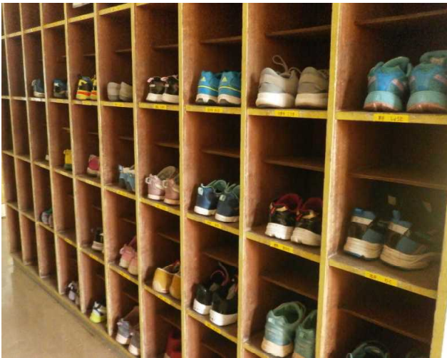
(毎日の下駄箱の靴を整えます)

の育成を合い言葉に、先を見通し、時間を大切に、朗らかで意欲的で、考える力と優しさを纏った広陽っ子を育てていきます。